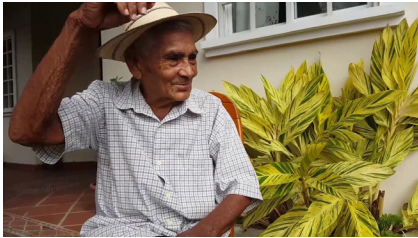
Cuentos del Abuelo Tin/ Tío Conejo y Tío Lobo

https://www.youtube.com/watch?v=JAVOuU61c4w