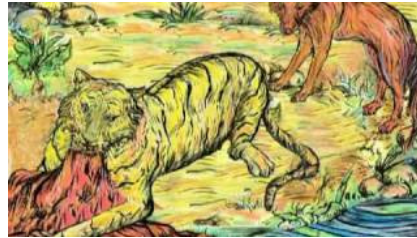
El tigre y el zorro

https://www.youtube.com/watch?v=JAVOuU61c4w